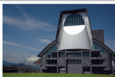
静岡県コンベンションアートセンター グランシップ

駐車場は、普通乗用車400台(うち車椅子使用者用7台)がご利用頂けますが催事の開催状況によっては満車となる場合があります。近隣には他の駐車場がありませんので、できるだけ公共交通機関をご利用くださいますようお願い申し上げます。